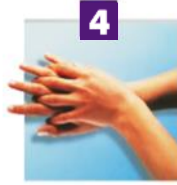
Espaces interdigitaux externes