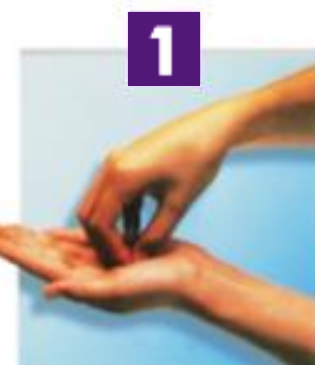
Bouts des doigts

Frictionnez vos mains, c'est pour votre bien !