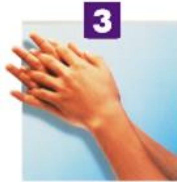
Espaces interdigitaux internes