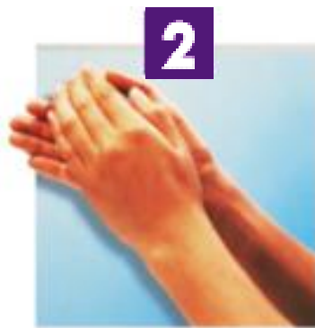
Paume contre paume et tranchant